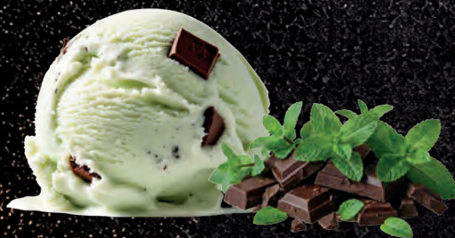
MIĘTA Z CZEKOLADĄ