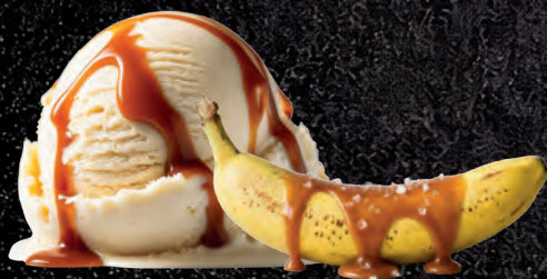
BANAN Z SOSEM SŁONY KARMEL